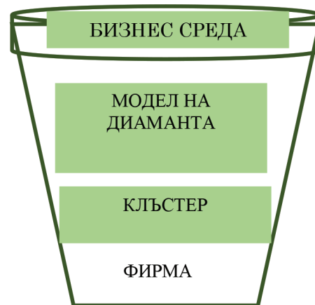
Фигура 2. Нива на националната среда

някага обозначена като „микроконкурентоспособност“), като подчертава решаващата роля на динамиката на клъстерите в този процес. По този начин националната среда, в която се появяват и развиват фирмите, се състои от три нива: клъстер, микроикономическата бизнес среда (диаманта на М. Портър) и обща бизнес среда (Sölvell et al. 2003).