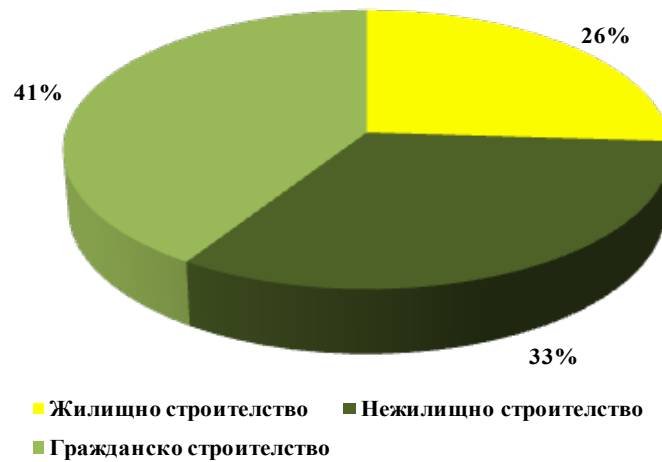
Фигура 1. Структура на приходите от дейността на строителните предприятия за 2009 г.