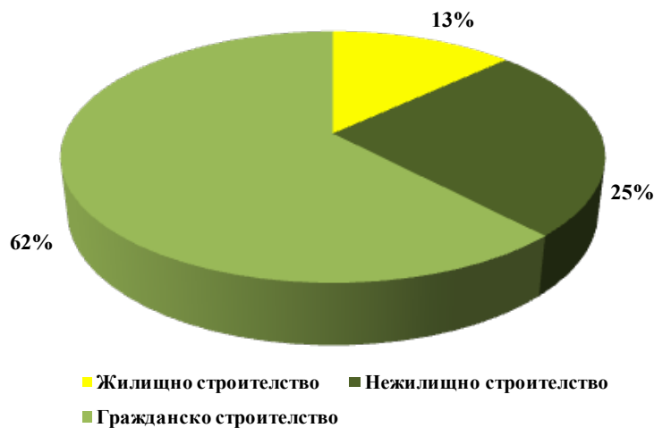
Фигура 2. Структура на приходите от дейността на строителните предприятия за 2013 г.