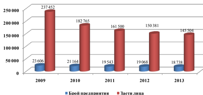
Фигура 3. Брой предприятия и брой заети лица в сектор "Строителство" за периода 2009-2013 г.