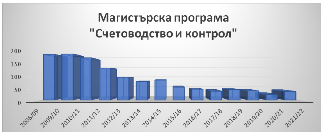
Фигура 3. Студенти от специалност „Счетоводство и контрол“, магистърска програма за периода 2005/2006 – 2021/2022 учебни години (авторова)

авторовия опит като преподавател по счетоводни дисциплини, първоначално като асистент и понастоящем като гоцент към Програмния съвет на Образователна програма по Счетоводство и финанси на БСУ, с повече от 20 години преподавателски стаж. Натрупаният опит провокира автора да представи част от своите виждания като преподавател във висше училище по счетоводни дисциплини