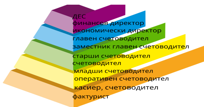
Фигура 1. Пирамида на „семејството“ на професията Счетоводител. ( https://www.ipsb.bg )

Към 25 януари 2023 година по данни на Job tiger Bulgaria ( https://www.zarplatomer.bg/ ) средната месечна работна заплата на специалист „Счетоводител“, варира от 988 лв. до 2189 лв., като само 10% от всички работещи в професията получават по-ниски от посочените минимални доходи. В класирането по работни заплати у нас професията заема 348-о място. Средната възраст на работещите професията е 37 години. Въпреки че професията „Счетоводител“ в широкия смисъл на понятието се упражнява, без да има поставени полови ограничения, по статистически данни 85% от работещите счетоводни специалисти са жени.