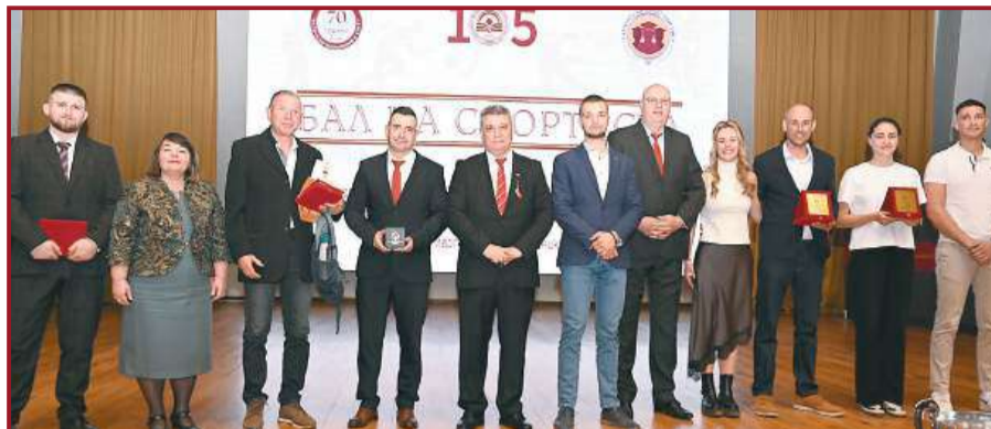
Петото издание на „Бал на спортиста“ отличи най-успешните студенти, отбори и треньори на УНСС за 2025 г.

Ако има нещо, което нашият спортист поставя над златния медал, това е признателността към хората, осветили пътя му. В центъра на неговия разказ стои доц. д-р Ла-