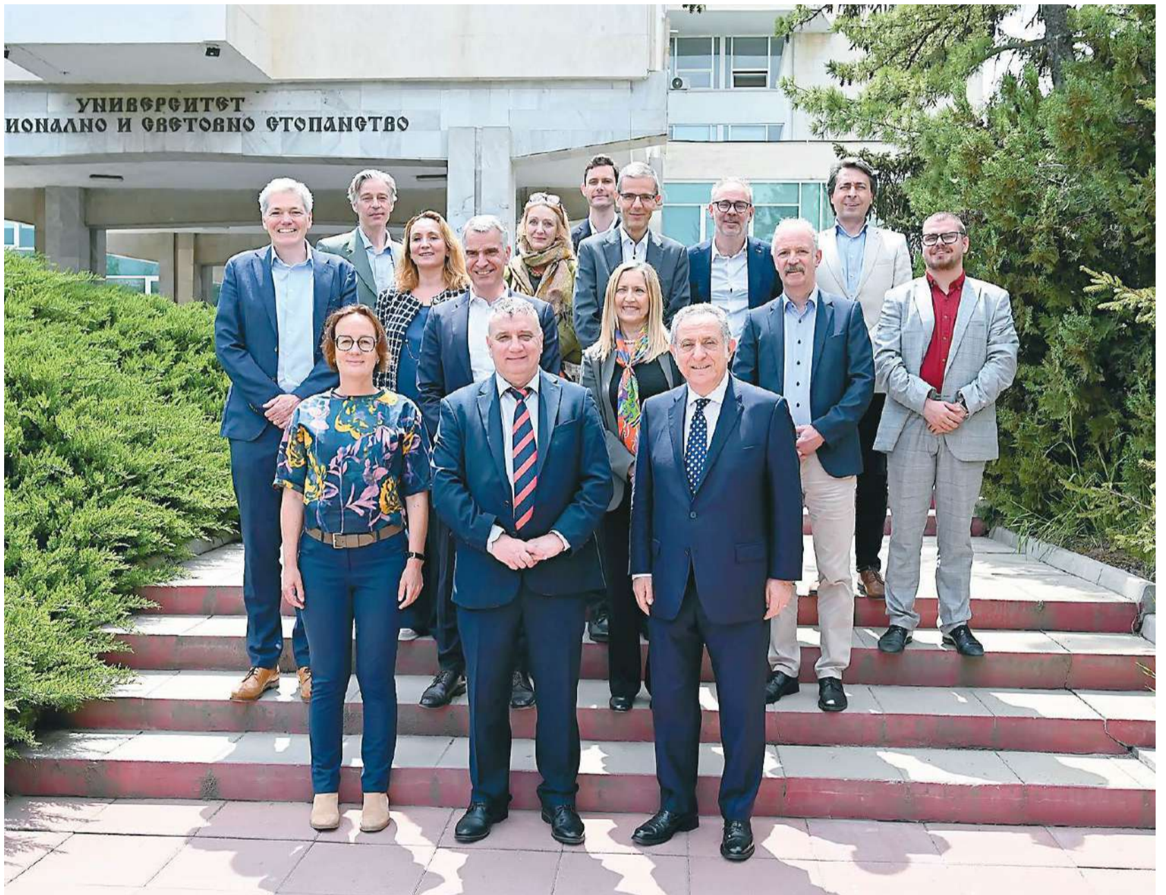
За стратегическата среща в УНСС пристигнаха ректорите и представители на ръководствата на десетте университета в организацията