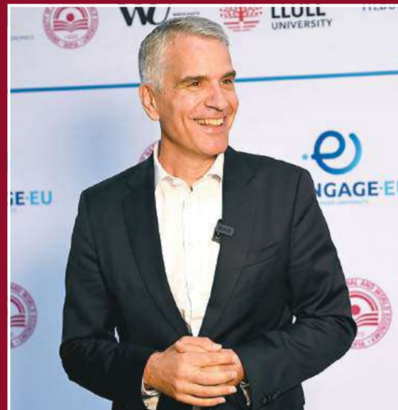
Проф. Томас Фетцер, ректор на Университета в Манхайм, Германия