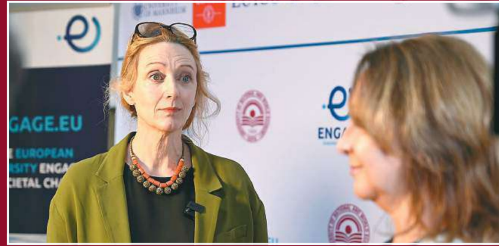
Проф. Марион Фартен, зам.-ректор на Университета „Тулуза Капитол“, Франция