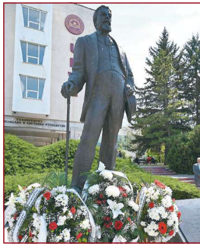
Празникът завърши пред Паметника на проф. Стефан Бобчев, където ректорското ръководство, преподавателите, Студентският съвет и гостите поднесоха цветя