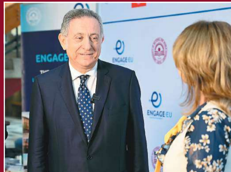
Проф. Карло Галучи, зам.-ректор на Университета „Рамон Лул“, Испания