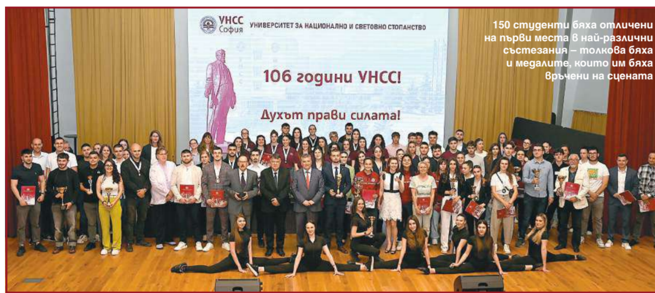
150 студенти бяха отличени на първи места в най-различни състезания – толково бяха и медалите, които им бяха връчени на сцената

На своя 106-и рожден ден УНСС пое ангажимент за „бъдеще без граници“, за равен достъп до образование за всяко българско дете, зелени кампуси и поколение студенти, което вече печели на терена и в аудиторията