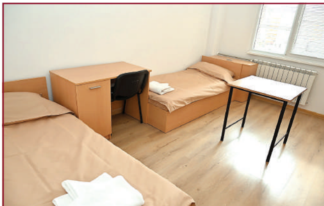
Стаите са оборудвани с нови мебели – легла, бюра, гардероби.