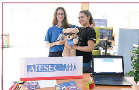
Клуб АIESEC ви очаква!