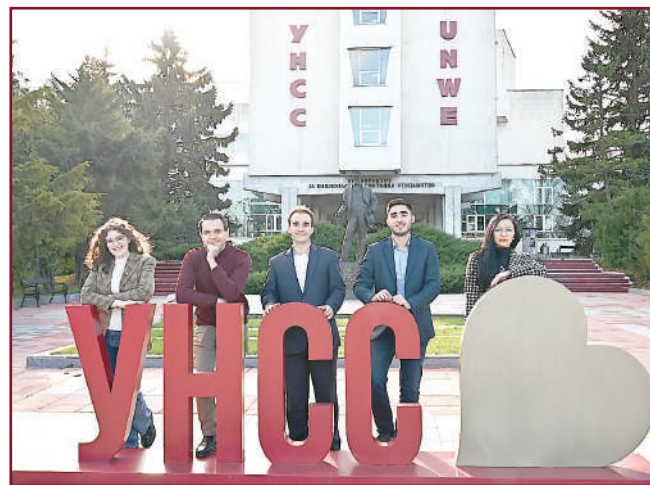
Добре дошли в нашия университет.

култета: Общикономически, Финансово-счетоводен, Управление и администрация, Икономика на инфраструктурата, Международна икономика и политика, Приложна информатика и статистика, Бизнес факултет и Юридически факултет; 36 катедри; 4 института; 32 научноизследователски центъра и др.