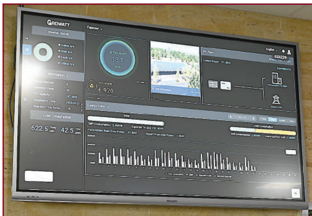
Мониторите, които са част от системата „Умен дом“, отчитат в реално време спестената енергия.

Друго, което ще откриете при нас, са зарядни станции за електрически автомобили, както и зарядни станции за телефони, планшети и лаптопи. От сеп-