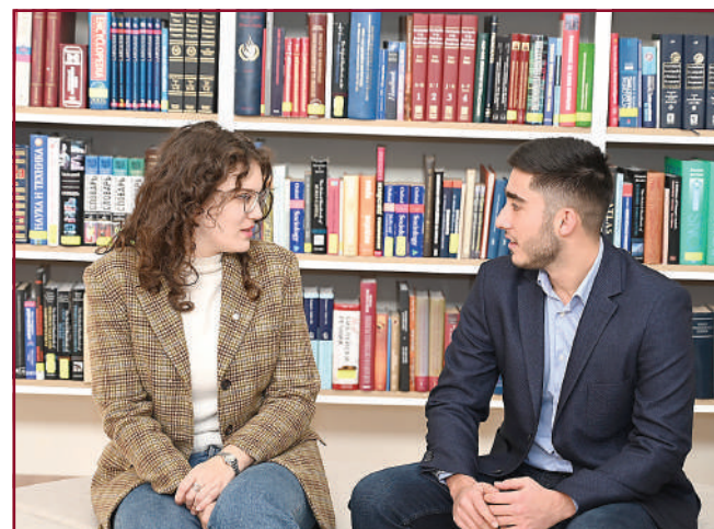
В спора се ражда истината.

Нашата библиотека не отстъпва от новите тенденции – даже тя е от първите в своето направление, започнали да дигитализират книжовното си наследство. Библиотеката на УНСС е създадена през 1923 г. и през годините преминава през много трансформации. Още през 2012 г. са купени Book скенер и автоматична машина за почистване на книги. Създадена е и дигитална библиотека. От скорошните нововъведения е станцията за самообслужване Bibliotheca selfCheck, която улеснява заемането и връщането на учебници и книги бързо и лесно. От 2022 г. вече читателските карти са обвързани със студентските книжки и е въведена система за електронен подпис.