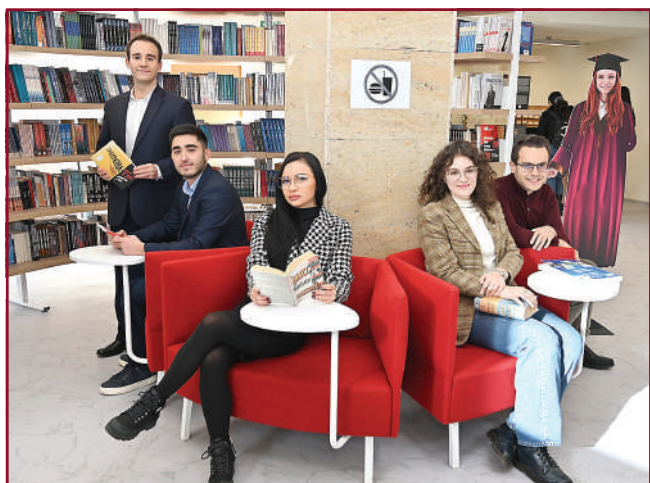
Модеризираната библиотека ви очаква!

С развитието на информационните и комуникационните технологии всички библиотеки са изправени пред нови предизвикателства. За да запазят силната си роля в обществото и най-вече в академичните среди, те започват да внедряват иновациите и в своята дейност.