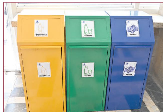
Разделно събиране за по-зелена планета.

Същото важи и за зарядните станции, чрез които можете да заредите телефон, таблет или лаптоп. Това е добра възможност за повечето студенти, тъй като много често се случва да забравяме зарядните си вкъщи. Ако разчитате на лаптопа или планшета си, за да бъдете отличници в университета, УНСС мисли точно за вас, защото такива станции можете да откриете във фоайетата на корпусите „А“, „В“, „Г“, „И“, както и на най-новия „К“ корпус. Инсталирани са общо 5 енергоспестяващи зарядни станции за телефони, планшети и лаптопи, всяка от които е оборудвана с LED осветление. Тези станции са на разположение на всички студенти, преподаватели и служители на уни-