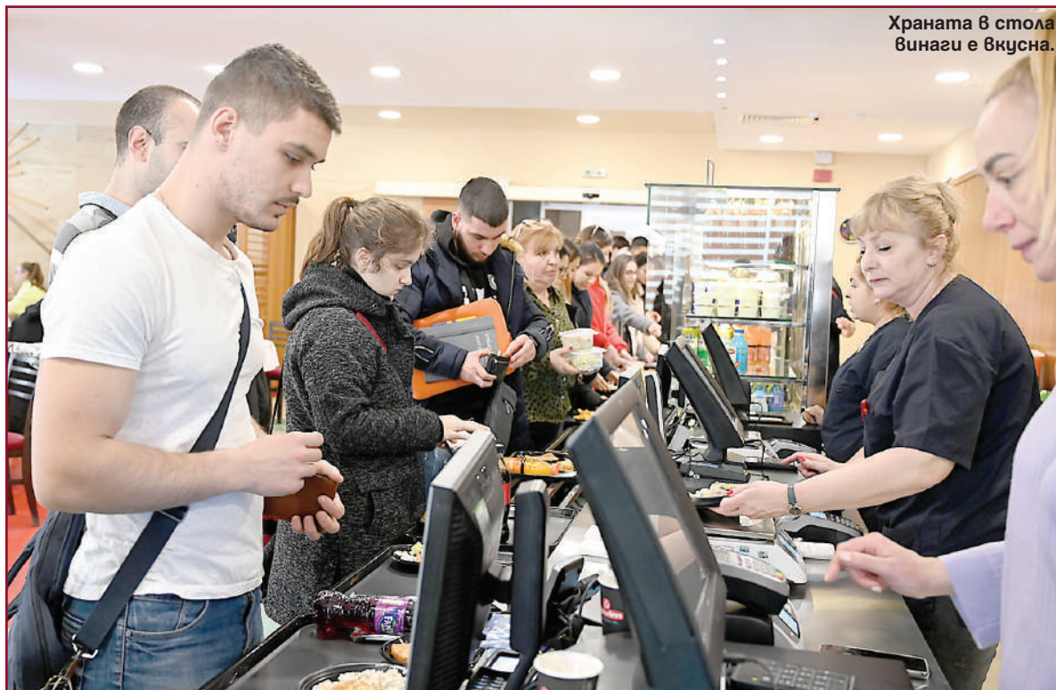
Храната в стола винаги е вкусна.