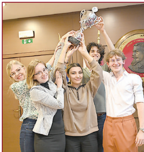
Пътят към успеха минава през УНСС.

В УНСС дигитализацията е развита на високо ниво. Студентската книжка е директно в телефона на студентите, а електронните услуги, които предлага университетът, спестяват опашките по гишетата и струпането на студентите. В системата Уеб Студент се предлагат над 21 онлайн услуги, които улесняват процесите по кандидатстване и записване.