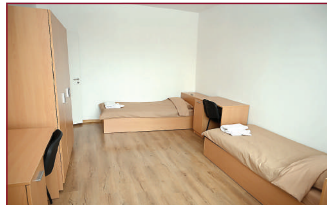
Тук се споделят смехът и тъгата, ученето и преживяванията.