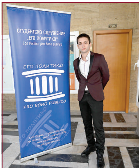
Представител на клуба „Его политико“.

„Екоклуб“ е студентска общност, която се фокусира върху значими теми от съвременното глобализирано общество: устойчиво развитие, замърсяване на околната среда, зелено предприемачество, кръгова икономика. Организиран се дискусии и събития, провеждат се доброволчески инициативи и акции, а в свободното си време клубът участва в състезания и преходи в планината. Може да откриете страницата на общността и в социалните мрежи. Членовете не се придържат към общоприетите норми. Те винаги работят в екип. Някои от инициативите им включват гаряването на капачки, озеленяването на дворните пространства в университета и предлагането на идеи за по-добро развитие на екологични проблеми.