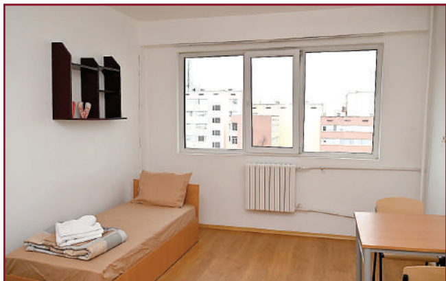
Блоковете на университета са реновирани и модернизирани.