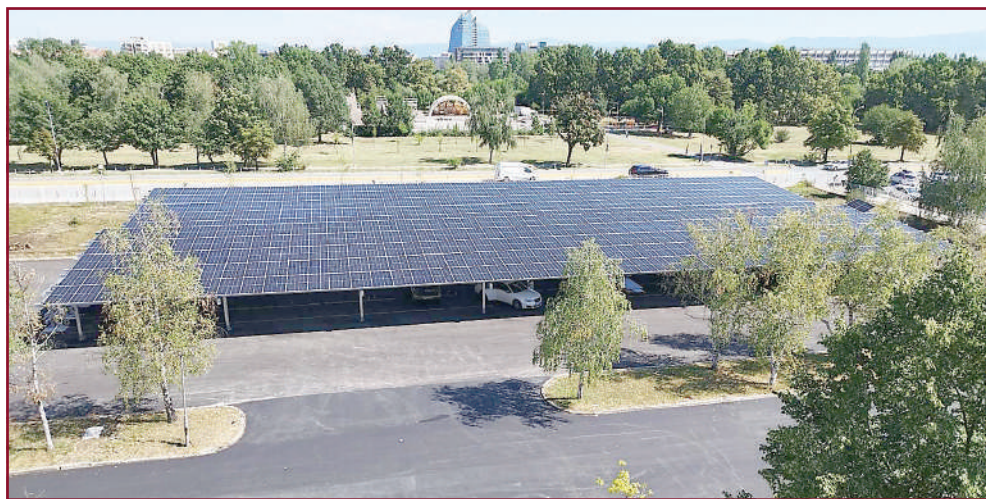
Университетът разполага с два фотоволтаични парка, изградени върху покрива и върху новоизградения паркинг.

Нашият университет е „зелен“ не само защото има много пространства, съобразени с околната среда. Но и защото все повече внедрява и използва енергийно ефективни практики, съобразени с минималното замърсяване на природата.