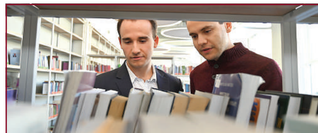
Изцяло нови рафтове с многобройни книги, които студентите могат да заемат.

На 14 ноември 2023 г. бе официалното откриване на реновираната библиотека, на което присъстваше министър-председателят на Република България акад. Николай Денков. „Всички виждаме, че усилията са си стрували. Радвам се, че един от приоритетите ви е бил именно модернизиранието на библиотеката.