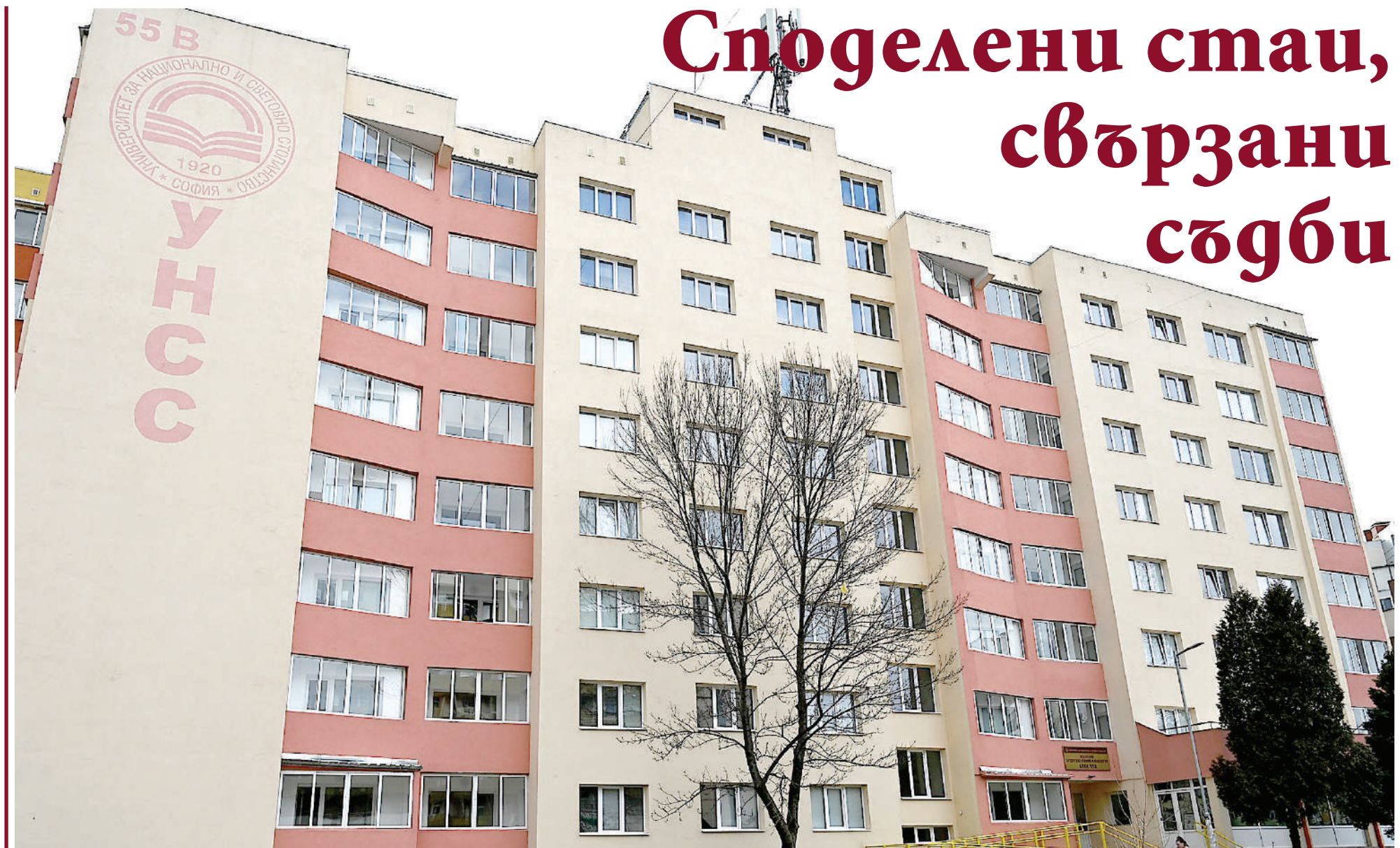
Добре дошли в студентската крепост!

Общежитията са известни още като крепостта на студентите. В тях се разиграва невероятна сага, която би могла да се конкурира с историите за Хари Потър. Тук, сред книги, лаптопи и огромни купища с учебници, се развиват всякакви случки.