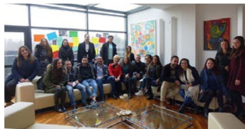
2. Estudiantes de Ciencias Políticas de la Universidad con su profesora

La enseñanza en la Facultad de Económicas y Políticas Internacionales ofrece conocimientos fundamentales en los tres departamentos respectivos de Relaciones Económicas Internacionales y Negocios , Relaciones Internacionales y Ciencias Políticas . El Departamento de Lenguas Extranjeras y Lingüística Aplicada que ofrece la preparación en lenguas extranjeras para toda la universidad forma también parte de esta Facultad donde