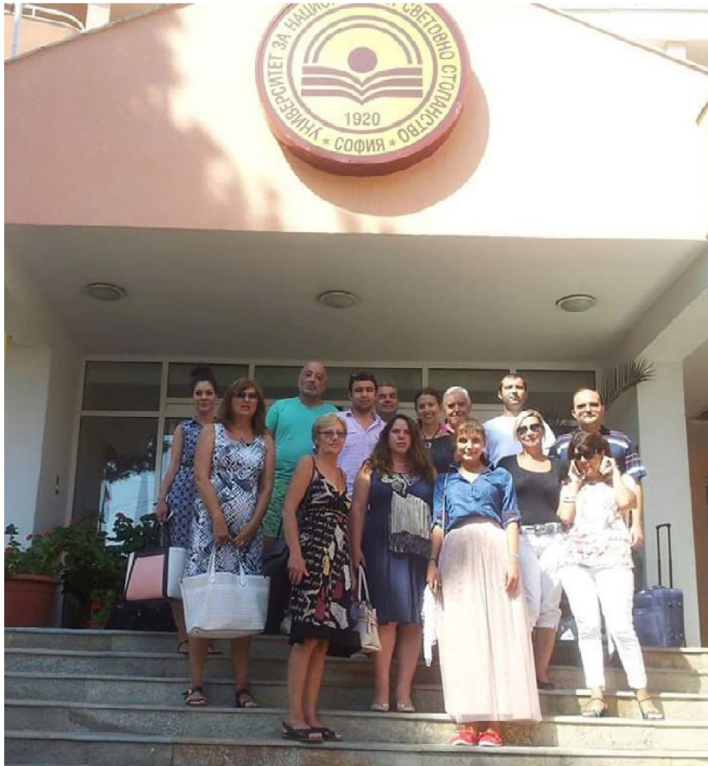
3. Profesores de lenguas extranjeras en la UENM en una conferencia sobre Comunicación Intercultural , organizada en la Residencia Recreacional y Educativa de la UENM en la ciudad de Ravda, vecina a la ciudad de Nesebar en el Mar Negro