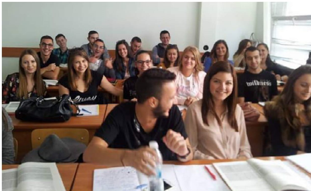
5. Estudiantes búlgaros en clase de español